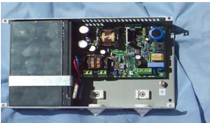
Likriktare typ LEIF 12/2,5 med batteri monterat.